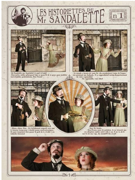
Les Historiettes de M. Sandalette, tous droits réservés Anxiogène/Futuravapeur, 2007

Les aventures de Maurice Sandalette, anti-héros normand uchronique, se déclinent sous la forme d'un roman-photos rétro colorisé. Ces historiettes se regardent aussi bien en une seule planche qu'en série. Elles seront mises en scène à côté d'objets issus des réserves du musée et sélectionnés par Futuravapeur. Une façon originale de découvrir une partie inconnue des collections du musée Thomas Henry !